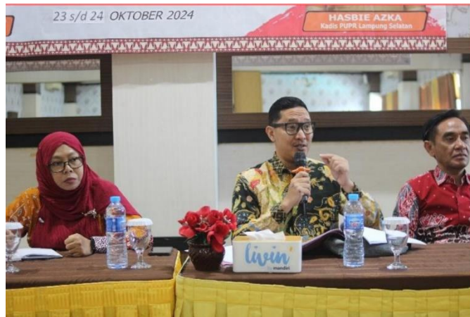
Gambar 5. Para Nara Sumber pada Kegiatan Pelatihan