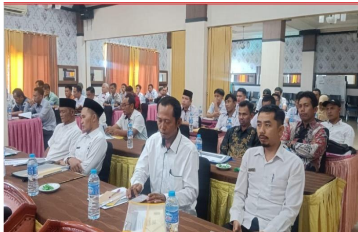
Gambar 6. Pelaksanaan Kegiatan yang Berlangsung Tertib