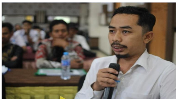
Gambar 3. Antusiasme Kepala Desa dalam Kegiatan Pelatihan