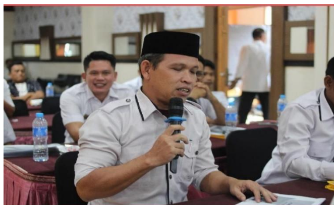
Gambar 4. Antusiasme Kepala Desa agar Pelatihan Sejenis Diadakan Kembali