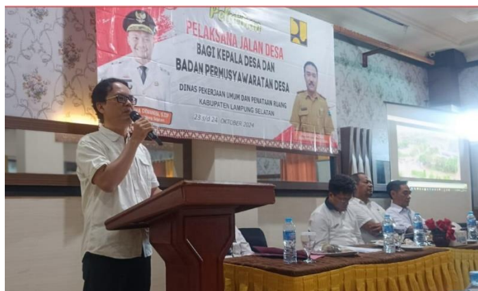
Gambar 2. Dokumentasi Pembukaan oleh Sekdin DPUPR Lampung Selatan

Dengan meningkatnya pemahaman teknis aparat desa, diharapkan pengelolaan pekerjaan fisik Dana Desa dapat dilaksanakan secara lebih tertib, sesuai standar teknis, dan selaras dengan ketentuan regulasi. Kondisi ini berpotensi menurunkan risiko kesalahan teknis dan administratif yang selama ini menjadi salah satu penyebab utama munculnya temuan audit dan permasalahan hukum dalam pengelolaan Dana Desa.