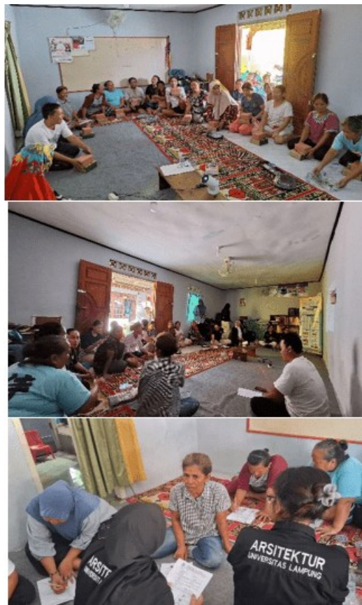
Gambar 9: sosialisasi dan edukasi masyarakat

Sosialisasi dilaksanakan pada tanggal 21 September 2025 dengan pendekatan partisipatif yang menekankan keterlibatan aktif masyarakat dalam setiap proses kegiatan. Pendekatan ini bertujuan agar warga tidak hanya menjadi penerima informasi, tetapi juga mampu memahami dan mengaplikasikan pengetahuan yang diberikan secara mandiri. Proses penyampaian dilakukan secara terbuka dan komunikatif, dengan mengedepankan prinsip saling berbagi pengalaman dan pengetahuan antara tim pengabdian serta masyarakat setempat. Suasana kegiatan dikondisikan agar inklusif dan dialogis sehingga masyarakat merasa memiliki ruang untuk bertanya, memberikan pendapat, serta menyampaikan gagasan yang relevan dengan konteks lingkungan mereka.