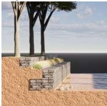
Gambar 8: Ilustrasi retaining wall

Solusi ketiga adalah pembangunan retaining wall atau dinding penahan tanah di kawasan pesisir untuk mengurangi abrasi, menahan tekanan air laut, dan melindungi permukiman dari kerusakan akibat gelombang.