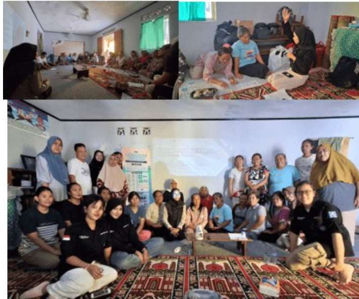
Gambar 1. Dokumentasi Kegiatan

creation of knowledge, di mana pengetahuan lokal dan keilmuan akademik saling melengkapi untuk menghasilkan solusi yang relevan dan aplikatif.