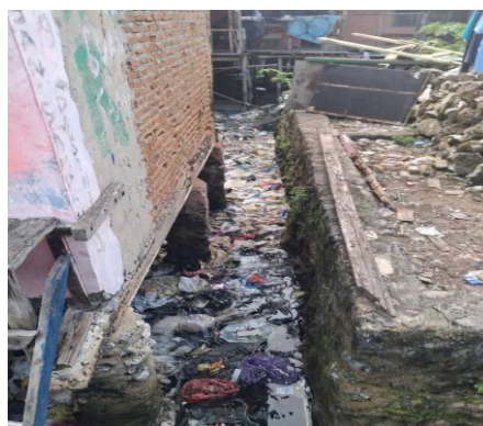
Gambar 2: Observasi Kawasan

1. Observasi lapangan dilakukan secara langsung untuk mengidentifikasi kondisi fisik lingkungan, termasuk infrastruktur pesisir, sistem drainase, kondisi rumah warga, serta perilaku dan pola adaptasi masyarakat terhadap bencana. Metode observasi ini mengikuti pendekatan kualitatif deskriptif sebagaimana disarankan oleh Creswell (2014), yang memungkinkan peneliti memahami fenomena sosial secara mendalam melalui interaksi langsung dengan subjek penelitian.