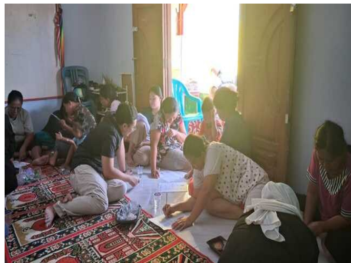
Gambar 4: Pendampingan Warga

3. Kegiatan diskusi dan simulasi turut dilaksanakan sebagai bentuk interaksi dua arah antara tim pelaksana dan masyarakat. Dalam sesi ini, warga diajak untuk menyampaikan pengalaman, pandangan, dan aspirasi terkait kebutuhan ruang hunian yang tangguh terhadap perubahan iklim, serta berpartisipasi dalam menggambarkan bentuk solusi ideal menurut persepsi mereka.