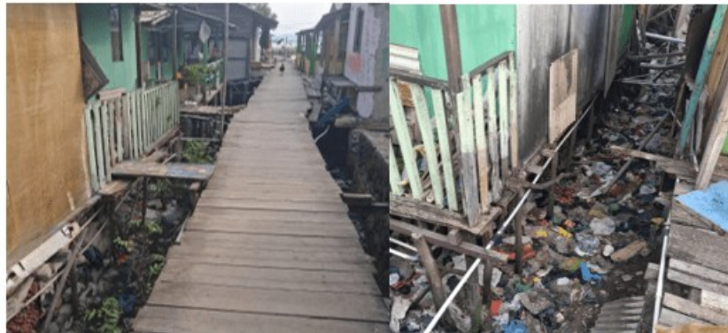
Gambar 5: Tinjauan Lokasi Lainnya

Kegiatan pengabdian kepada masyarakat dengan judul “Sosialisasi Inovasi Rumah Apung sebagai Strategi Tanggap Bencana di Kecamatan Panjang” dilaksanakan di Kelurahan Panjang Selatan, Kota Bandar Lampung, yang merupakan salah satu wilayah pesisir dengan tingkat kerentanan tinggi terhadap bencana lingkungan. Berdasarkan hasil observasi lapangan dan wawancara awal dengan masyarakat setempat, diketahui bahwa sebagian besar rumah warga berada sangat dekat dengan laut, bahkan beberapa dibangun di atas air dengan menggunakan tiang kayu sebagai penopang utama. Kondisi ini memperlihatkan bahwa masyarakat telah beradaptasi secara sederhana terhadap keterbatasan lahan di kawasan pesisir, namun di sisi lain menunjukkan tingginya tingkat kerentanan terhadap ancaman banjir rob, abrasi pantai, dan keterbatasan jalur evakuasi. Pada saat pasang tinggi atau curah hujan yang intens, air laut sering meluap hingga ke area permukiman dan menyebabkan genangan berkepanjangan yang berdampak pada kerusakan rumah, fasilitas umum, serta menurunkan kualitas hidup warga. Kondisi lingkungan semakin diperburuk oleh sistem drainase yang tidak memadai serta penumpukan sampah rumah tangga di area sekitar pemukiman yang menyumbat aliran air. Akumulasi sampah tersebut tidak hanya memperparah genangan, tetapi juga menimbulkan bau tidak sedap, mengganggu estetika lingkungan, dan meningkatkan potensi penyakit berbasis lingkungan seperti diare dan demam berdarah.