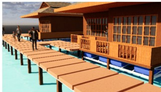
Gambar 6: Ilustrasi rumah amfibi

Selain sebagai inovasi teknis, konsep ini juga mencerminkan arsitektur adaptif yang ramah lingkungan, sesuai dengan karakteristik kawasan pesisir. Melalui kegiatan sosialisasi, tim pengabdian memperkenalkan prinsip kerja, keunggulan, dan potensi penerapan rumah amfibi di Panjang Selatan. Inovasi ini diharapkan menjadi model hunian pesisir yang aman, efisien, dan berkelanjutan, sekaligus meningkatkan ketahanan masyarakat terhadap bencana air tanpa harus berpindah dari lingkungan tempat tinggalnya.