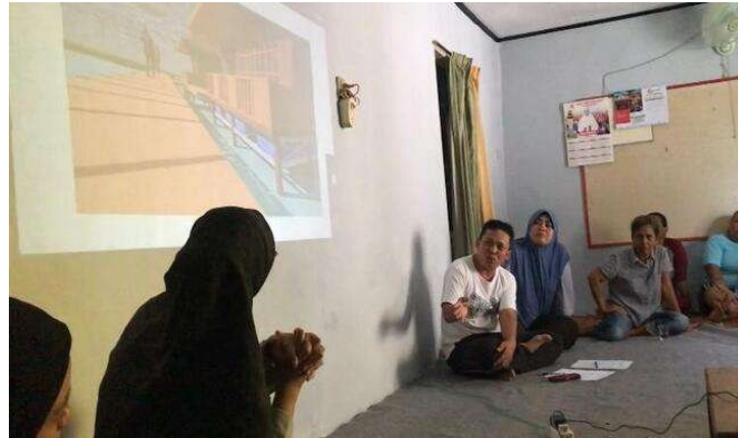
Gambar 3: Pemaparan Materi Presentasi

menyajikan ide arsitektur kompleks secara sederhana dan komunikatif (Bray et al., 2015). Selain itu, metode ini juga membantu masyarakat untuk lebih mudah membayangkan penerapan solusi desain adaptif di lingkungan tempat tinggal mereka.